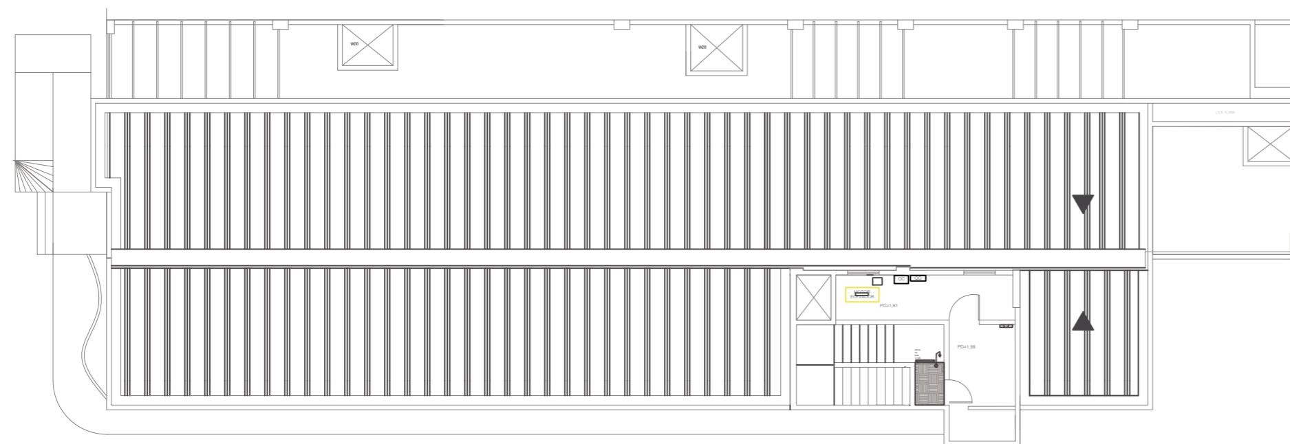
PLANTA BAIXA - COBERTURA